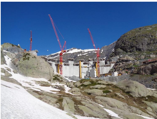
Barrage du Vieux-Emosson, mesures durant le chantier

Alpiq Suisse SA – Hydro-Exploitation SA – Nant de Drance – Etat du Valais – Canton de Vaud – Services industriels de Lausanne – Services industriels de Genève