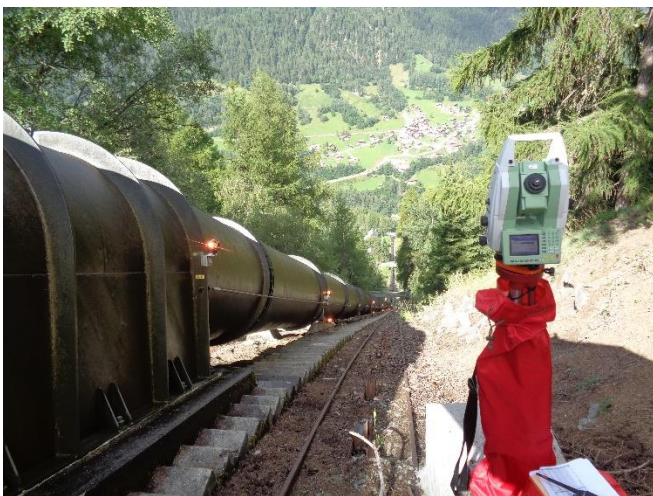
Mesures d'une conduite forcée