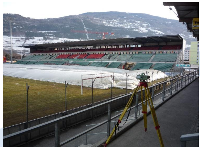
Nivellement de précision